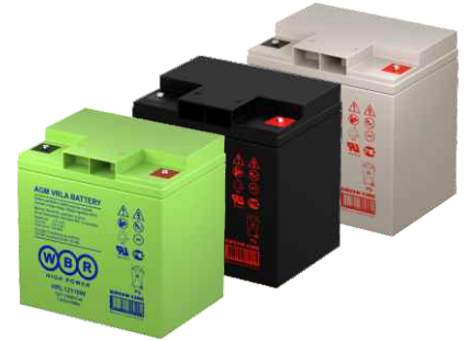
*- Выпускается в трех цветовых корпусах