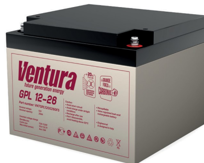
Габаритные размеры, мм