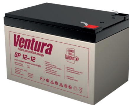
Габаритные размеры, мм